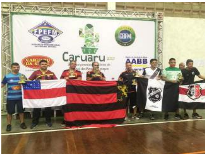
Podium Adulto – 5ª Divisão