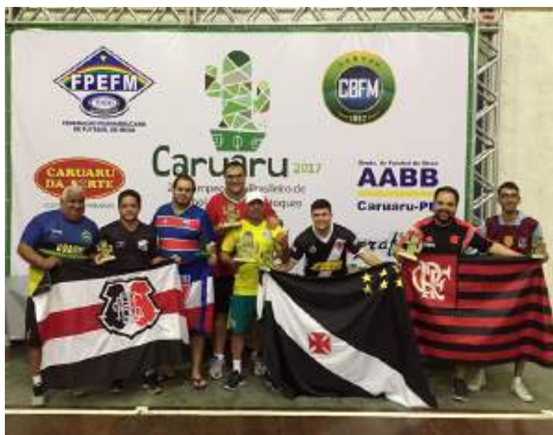
Podium Adulto – 2ª Divisão