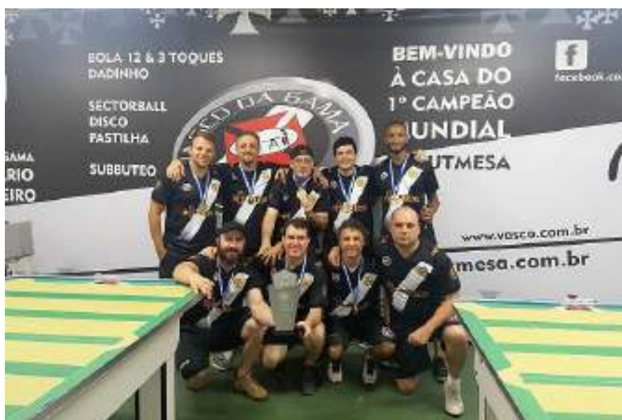
Vasco da Gama