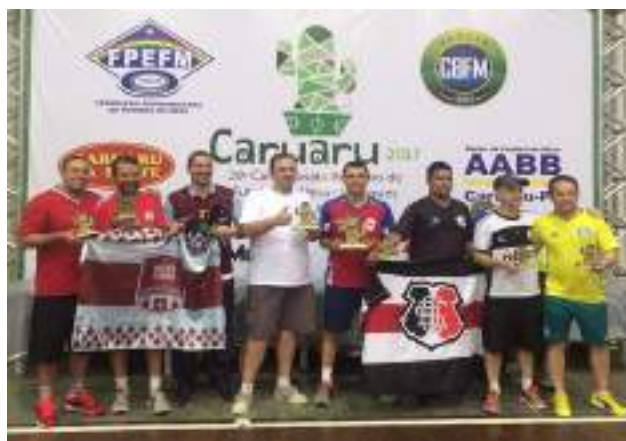
Podium Adulto – 3ª Divisão