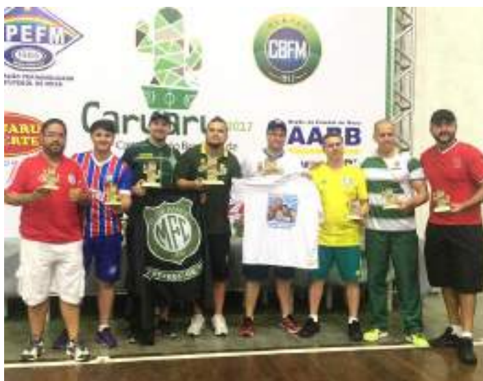
Podium da categoria Adulto – 1ª Divisão