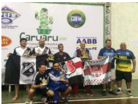
Podium Adulto – 4ª Divisão