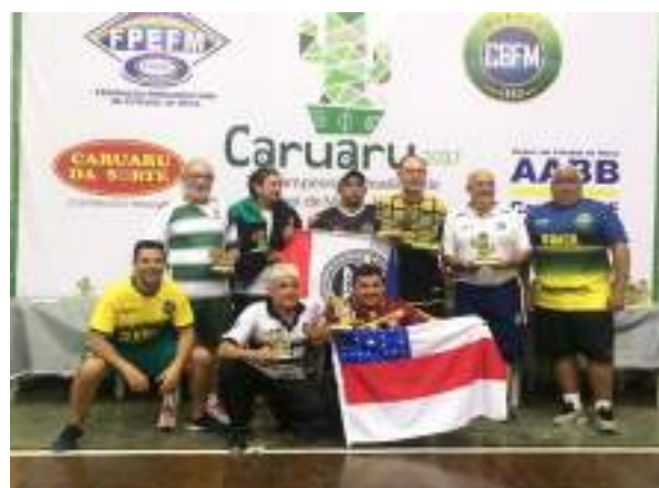
Podium Master – 3ª Divisão