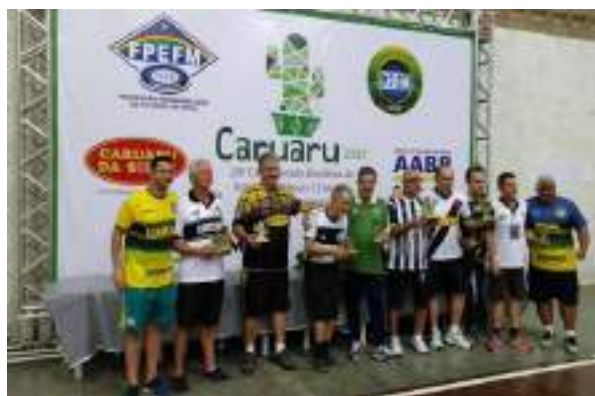
Podium Master – 2ª Divisão