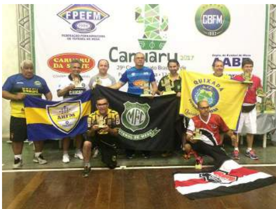
Podium Master – 1ª Divisão