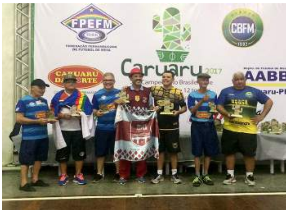
Podium Master – 4ª Divisão